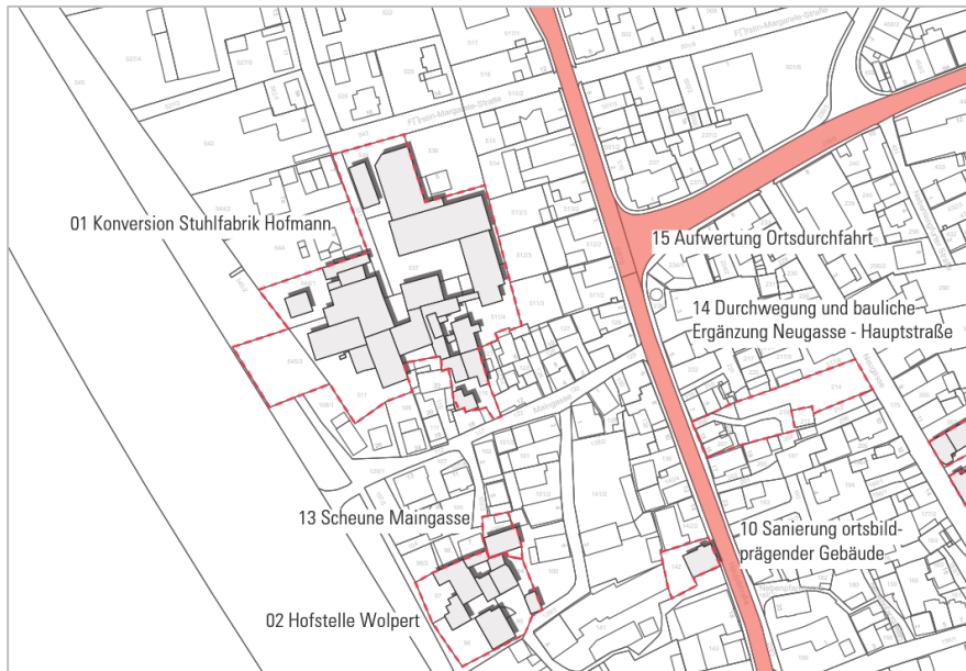
Karte 1: Ausschnitt ISEK Kreuzwertheim Kommunale Handlungsschwerpunkte im Ortskern Konversion Stuhlfabrik Hofmann (Nr. 01) (Stand 29.11.2017)

triebsflächen (2.000 - 2.500 m 2 Lager und Verwaltung) im Altortkern von Kreuzwertheim besitzt, in die neuen Gewerbeflächen nach Unterwittbach umzuziehen. Dadurch würden in zentraler Lage neue Wohnbauflächen mit bis zu 30 Wohnungen geschaffen werden. Im Hinblick auf die fehlenden Wohnungen im Markt Kreuzwertheim ein enormer Gewinn. Eine dringliche Neuausweisung von Wohnbauflächen am Ortsrand oder im Rahmen der Innenentwicklung kann derzeit nicht erfolgen, da die Potentiale weitgehend ausgeschöpft oder Flächen gemäß aktueller Umfrage bei den Eigentümern derzeit wegen der Grundbesitzverhältnisse nicht verfügbar sind.